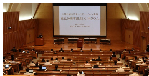
【シンポジウムの様子】