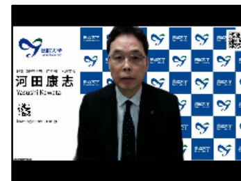
【開会挨拶】鳥取大学 河田理事

6) 植物生産を効率化する、新規発芽誘導物質による植物種子の発芽制御技術 岡山理科大学 生命科学部 生物科学科 講師 福井 康祐