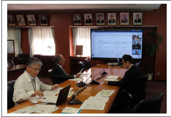
理事会の様子（鳥取大学）