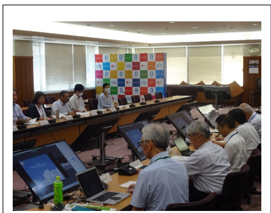
会議の様子 (岡山大学会場)